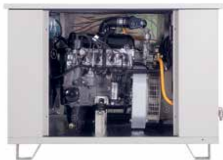
Рис. Генераторная установка ФАС-ВП