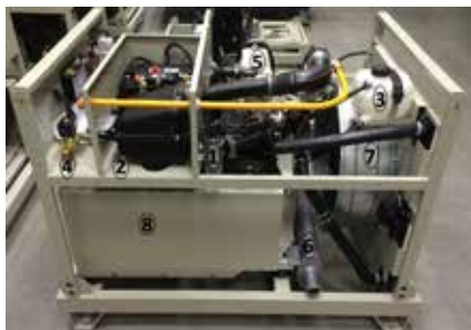
Рис. Генераторная установка ФАС-ВР

Для осуществления контроля и управления выходной мощностью и защиты от возможных сбоев в работе установка оснащена контроллером (подробная информация о настройке контроллера – в разделе 9).