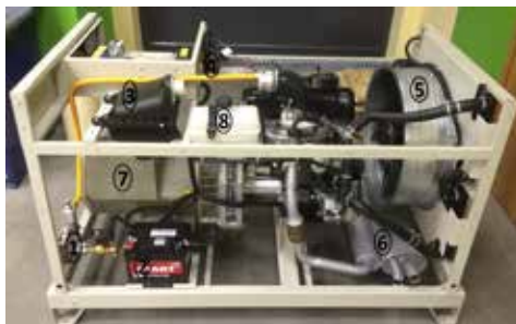
Рис. Генераторная установка ФАС-ОЗР/ВП