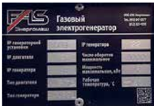
Рис. Табличка-шильда паспортных данных генераторной установки

Каждая генераторная установка имеет идентификационный номер, указанные на фирменном ярлыке-шильде (см. рис.), прикрепленном к основанию. Эта шильда содержит информацию о дате изготовления, напряжении, токе, мощности в кВА и кВт, частоте, коэффициенте мощности и массе генераторной установки. Эти данные необходимы для оформления заказов на запасные части, обоснования гарантии и заявок на сервисное обслуживание.